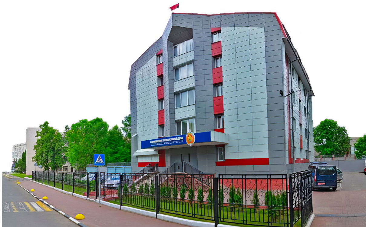
Фота: Кастрычніцкі РУУС г. Мінска, вул. Фабрыцыуса, 26. Крыніца: Яндэкс карты.

У жніўні 2020 года Кастрычніцкі РУУС Мінска, як і іншыя органы ўнутраных спраў Беларусі, актыўна ўдзельнічаў у прыцісненні масавых пратэстаў, якія выбухнулі пасля прэзідэнцкіх выбараў 9 жніўня.