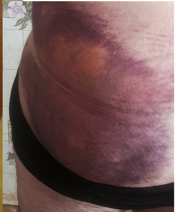
Фота: Шырокія гематомы на целе пацярпелых.

У медыцынскіх установах горада медыкі зафіксавалі ў пацярпелых шматлікія гематомы, памеры якіх дасягалі да 38–40 см.